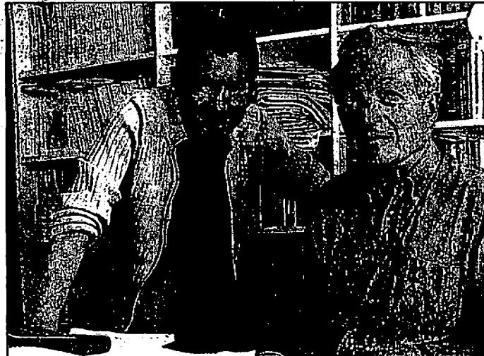
PARIS, HIER. Les électeurs de trois bureaux de vote d'Orsay pourront — en plus du vote traditionnel — tester un nouveau mode de scrutin inventé par deux mathématiciens de Polytechnique, qui permet de donner un avis sur tous les candidats en lice. (A.P.M.)